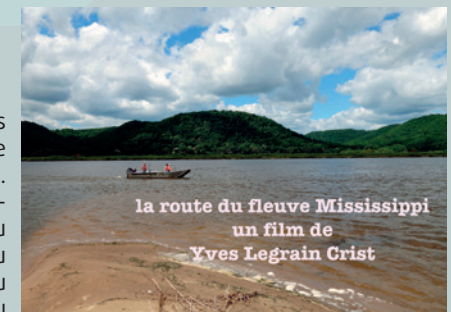
la route du fleuve Mississippi un film de Yves Legrain Crist

Depuis des millénaires, sur le lac Manchar au Pakistan, le peuple Mohana entretient une exceptionnelle symbiose, mêlée de jeu, d'amour et de violence avec les oiseaux dont ils connaissent tous les secrets. Hommes et oiseaux se côtoient, s'affrontent, se chérissent. Une cohabitation pacifique et harmonieuse nécessaire à leur bien-être.