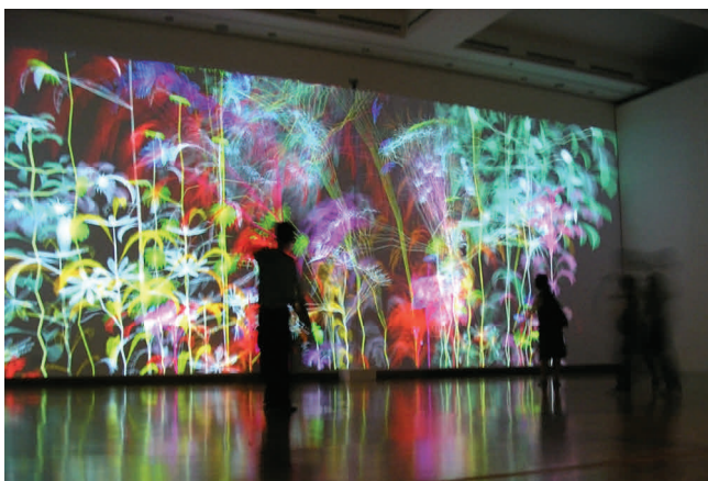
03 Miguel Chevalier, Ultra-Nature 2005, Sur natures Exposition « Digital Paradise », Metropolitan Museum of Art, Daejeon (Corée du sud) Installation de réalité virtuelle générative et interactive Logiciel : Music2eye ©Adagp, Paris, 2014