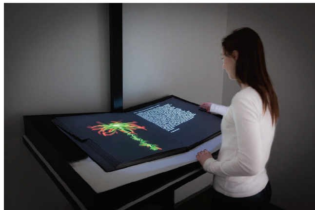
06 Miguel Chevalier, Herbarius 2059 , En collaboration avec Jean-Pierre Balpe, écrivain Installation de réalité virtuelle générative et interactive Logiciel : Cyrille Henry / Antoine Villeret ©Adagp, Paris, 2014