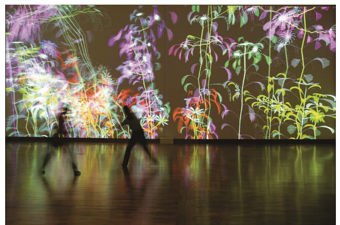
04 Miguel Chevalier, Ultra-Nature 2005, Sur natures Exposition « Digital Paradise », Metropolitan Museum of Art, Daejeon (Corée du sud) Installation de réalité virtuelle générative et interactive Logiciel : Music2eye ©Adagp, Paris, 2014