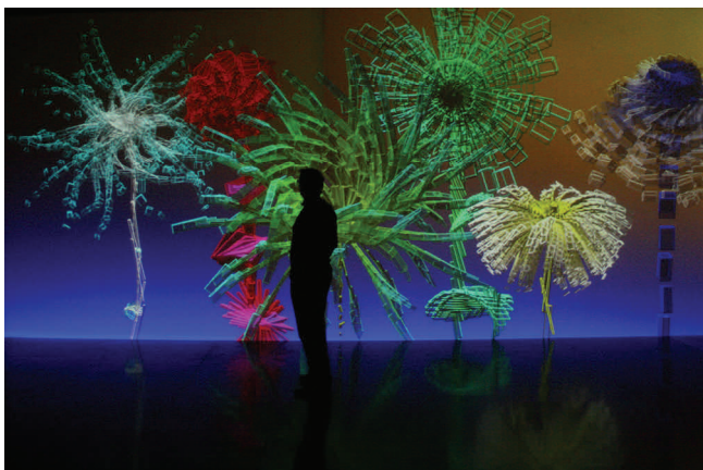
05 Miguel Chevalier, Fractal Flowers , 2009 Exposition « Inside, art & science », La Cordoaria, Lisbonne Installation de réalité virtuelle générative et interactive Logiciel : Cyrille Henry