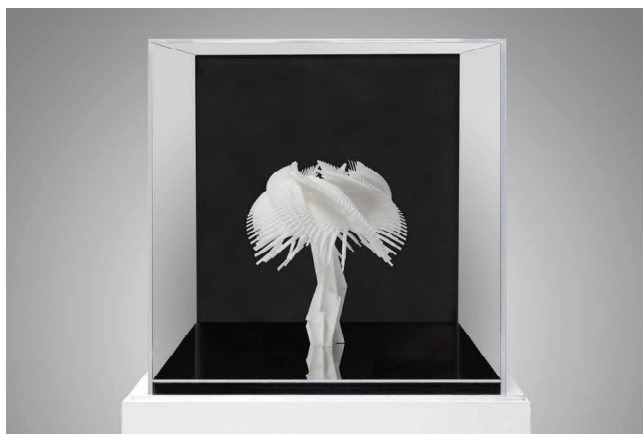
07 Miguel Chevalier, 2011, Lilus Arythmeticus dit d'Euclide Sculpture réalisée par impression 3D, résine 35 x 35 x 35 cm ©Adagp, Paris, 2014