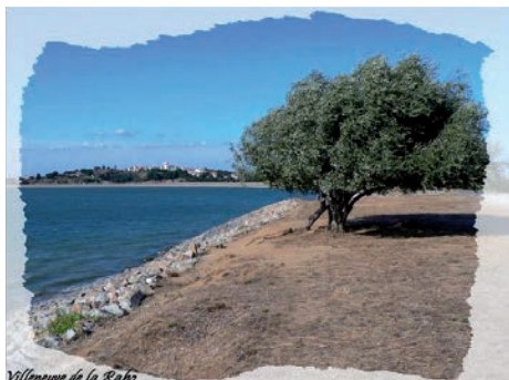
Villeneuve de la Raho

Contact 04 68 52 09 34 | Profession sport 66 | Coderpa | Cdos66 | Mutualité Française - Comité de randonnée